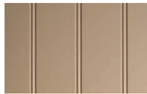
Profil: perlestaff Farge: Toast