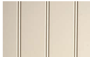
Profil: perlestaff Farge: Cafe Latte