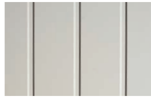
Profil: skygge Farge: Grå

Kan brukes til både oppussing og nybygg. Veggene er enkle å montere og gir god økonomi i byggeprosessen.