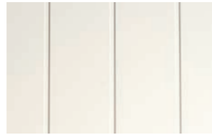
Profil: skygge Farge: Hvit