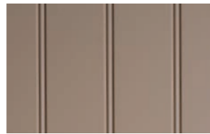
Profil: perlestaff Farge: Gren