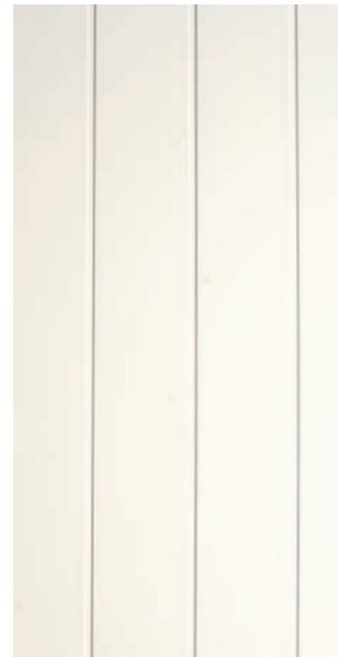
Profil: skygge Farge: hvit